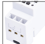
TSGE zaciski wyjściowe 1xN0 i 1xNC (max 2x2,5mm 2 )