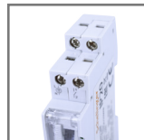
TSGM zacisk wyjściowy 1xN0 (max 2,5mm 2 )