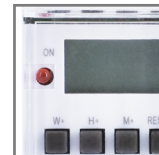
TSGE dioda sygnalizująca załączenie styku NC