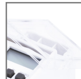
TSGE zamykana obudowa