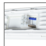
komora przyłączeniowa, możliwość zasilania przelotowego