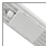
hermetyczna komora przyłączeniowa