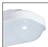
mleczny klosz oprawy