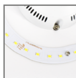
wbudowane źródła światła LED