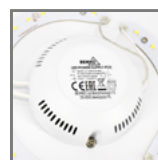
zasilacz zapewniający bezawaryjną pracę