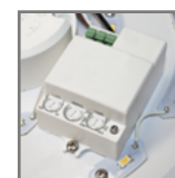
wbudowany czujnik ruchu w wersjach MS