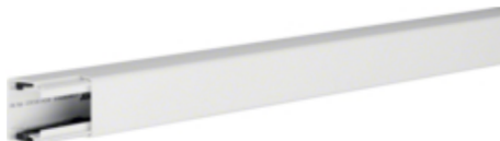
tehalit.LF Kanał elektroinstalacyjny PVC 30x30mm, biały