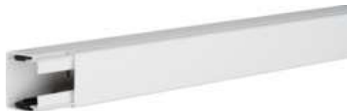
tehalit.LF Kanał elektroinstalacyjny PVC 40x40mm, biały