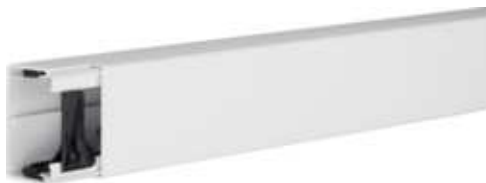
tehalit.LF Kanał elektroinstalacyjny PVC 40x60mm, biały