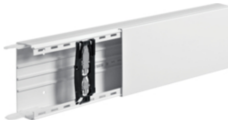
tehalit.LF Kanał elektroinstalacyjny PVC 60x150mm, biały