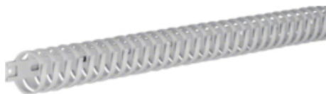
tehalit.VK flex 30 Kanał grzebieniowy L=500mm szary