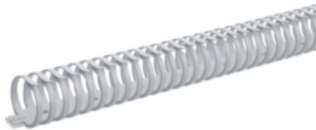
tehalit.VK flex 40 Kanał grzebieniowy L=500mm szary